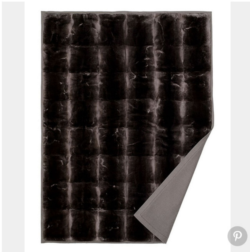
Couverture en fourrure doublée de cachemire (Loro Piana)