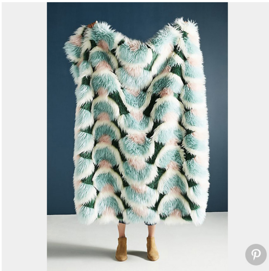
Plaid Juniper en fausse fourrure (Anthropologie)