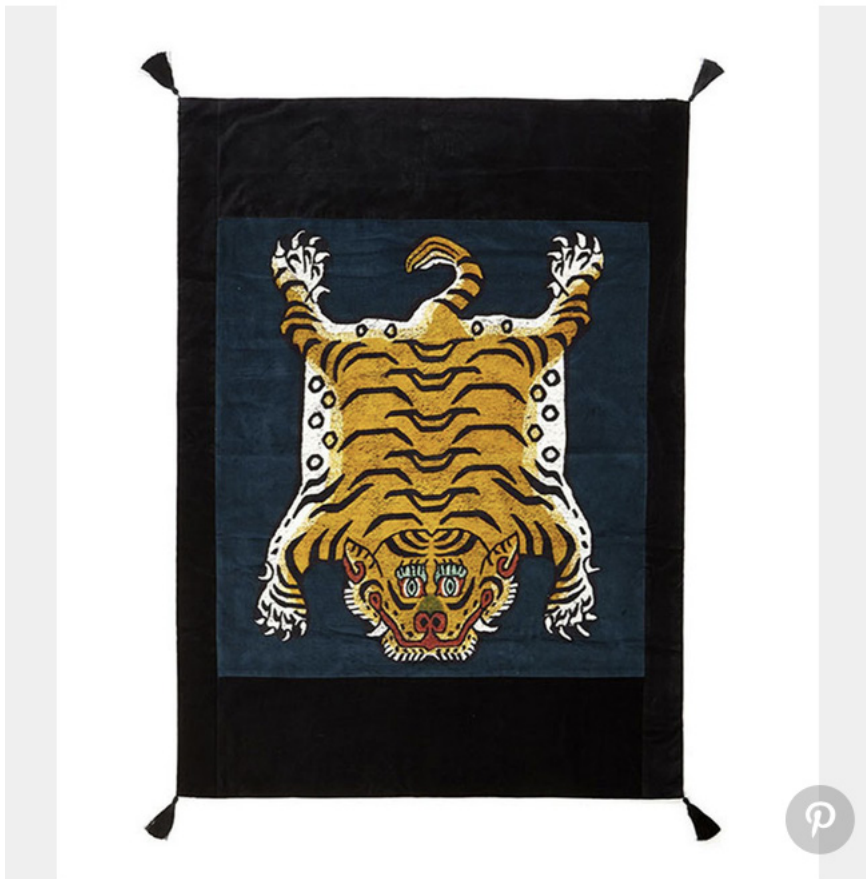
Plaid Saber Midnight en coton velours (House of Hackney)