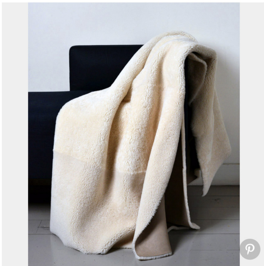
Plaid (Jules et Jim)