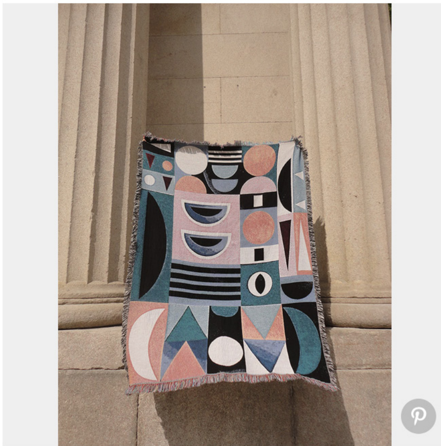
Plaid en coton tissé jacquard (Forget Me Not)