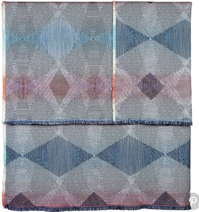
Plaid Lepidoptera en tissage jacquard,, collection Histoires Naturelles (No More Twist)